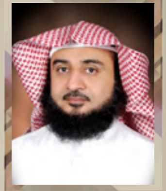
عميد شؤون أعضاء